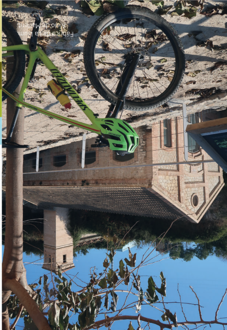
Fábrica de la Luz Aielo de Malferit