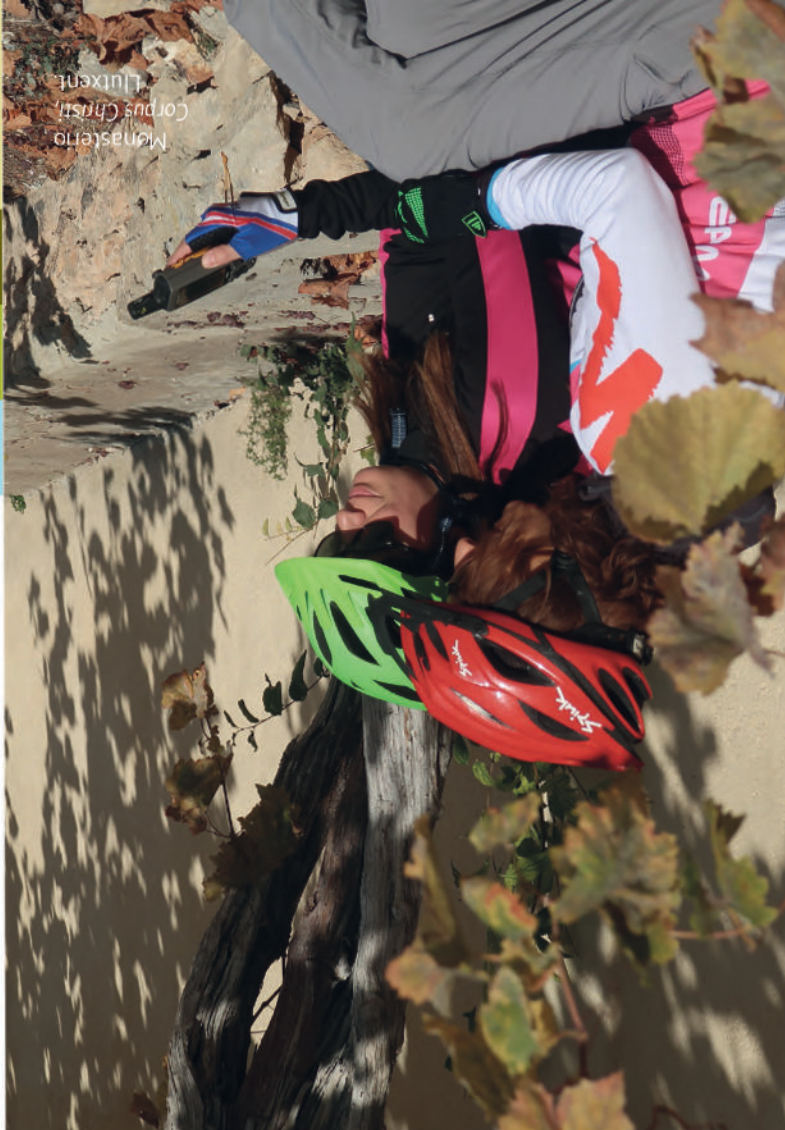
Monestrio Corpus Christi Llutxent