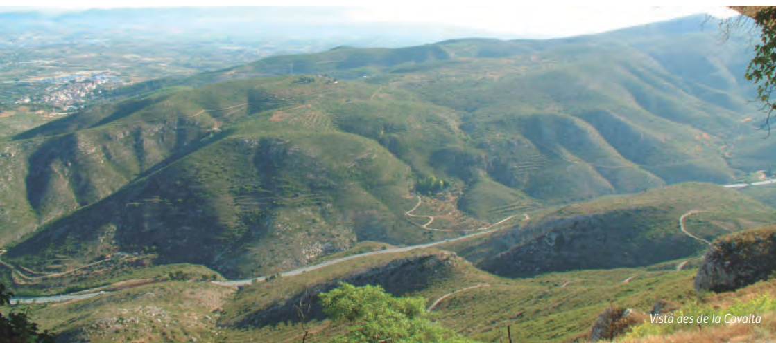
Vista des de la Covalta

An excellent way to enjoy and discover the diversity of the ecosystems, native flora and fauna is going around the natural and recreational areas in the Vall d'Albaida.