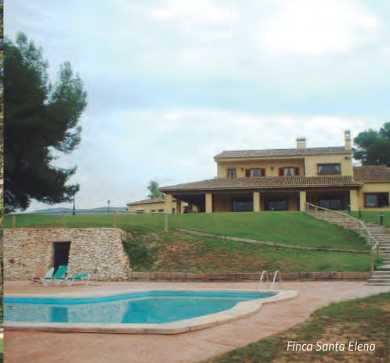
Finca Santa Elena