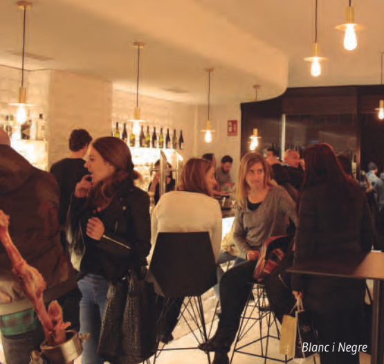
Blanc i Negre