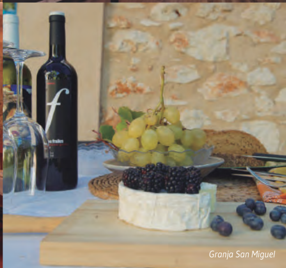
Granja San Miguel