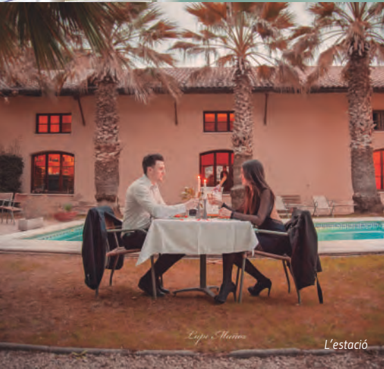
L'Espa i Marro