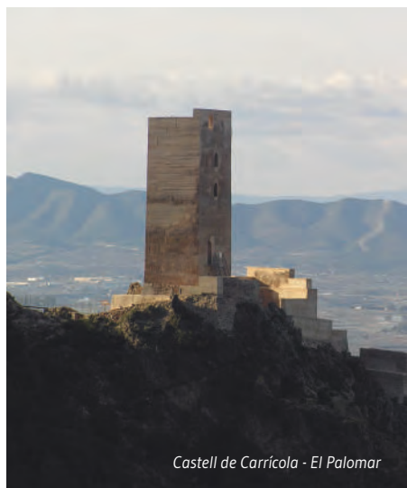
Castell de Carrícola - El Palomar

Una bona forma de gaudir i descobrir la diversitat dels ecosistemes, la flora i fauna autòctona és recórrer els espais naturals i les àrees recreatives de la Vall d'Albaida.