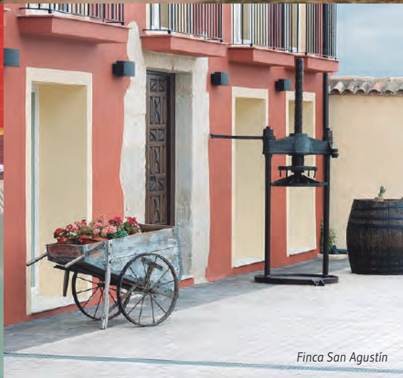
Finca San Agustín