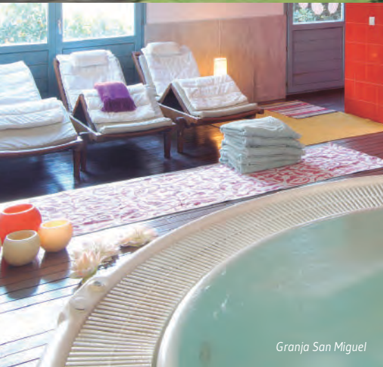
Granja San Miguel